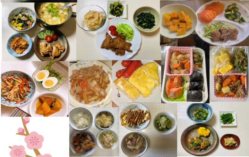
訪問介護で提供された料理です