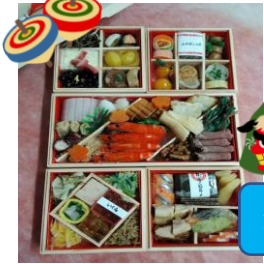
元旦におせち料理をいただきました