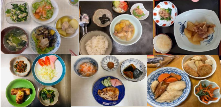
職員手作りの花です