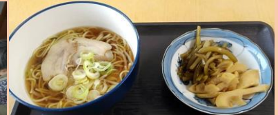
↑ふきと筍の煮物です ←ふきをみんなでむきました！