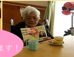
お誕生日 おめでとうございます！